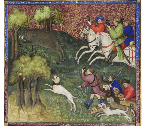
Livre de la chasse de Gaston de Phébus – 14e siècle

La chair d'oiseaux fait partie des viandes les plus appréciées car elles sont au sommet de la hiérarchie. Il n'est donc pas rare de voir du paon sur la table de certains grands banquets ! Cette viande est surtout mangée rôtie ou grillée.