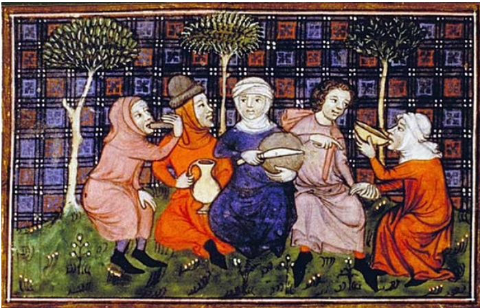
Livre du roi Modus et de la reine Ratio, 14e siècle

Contrairement à la noblesse, les laboratores consomment peu de viande. Quand il y en a, il s'agit surtout de viande de bœuf mangée bouillie et non rôtie.