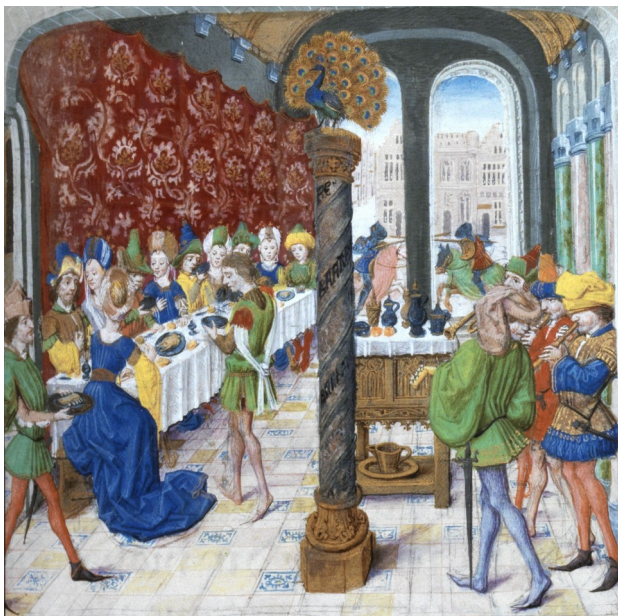
Livre des Conquestes et faits d'Alexandre, milieu du 15e siècle

Les banquets, avec leur succession de plats, sont souvent très longs et pour divertir et distraire ses convives, le seigneur peut faire appel à des ménestrels, c'est-à-dire des musiciens.