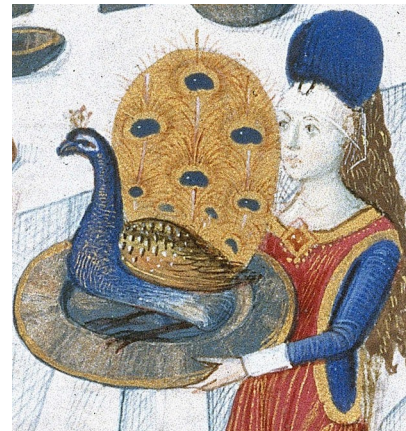
Livre des Conquestes et faits d'Alexandre, milieu du 15e siècle

Pour impressionner ses convives, le seigneur fait servir de très nombreux plats qui sont parfois mis en scène. Ainsi, le paon est servi à table avec ses plumes et on n'hésite pas à déguiser les mets pour surprendre (un poisson pourra être déguisé en viande!).