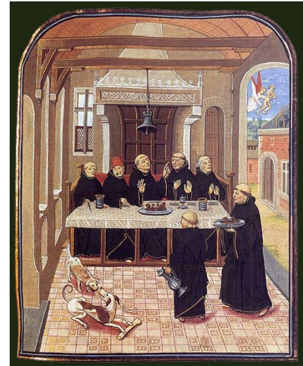
Recueil d'exemples moraux, XVe siècle

Tous ne vivent pas retirés du monde, certains sont en contact avec la société, comme les prêtres, c'est le clergé séculier*. Eux, sont autorisés à manger de la viande.