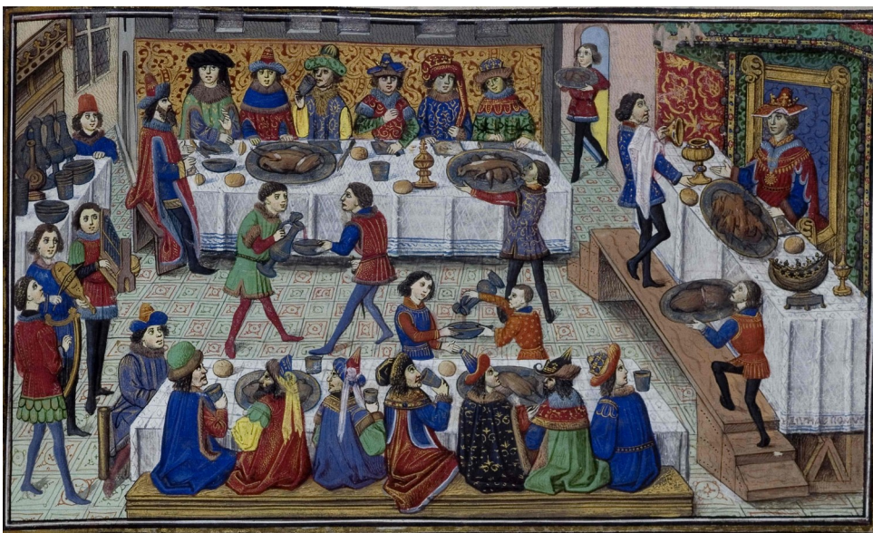
Livre des Conquestes et faits d'Alexandre, milieu du 15e siècle

Organisé dans la grande salle d'un château, des tables sont disposées en U dans la pièce. La table centrale est pour le seigneur et ses invités prestigieux, elle peut éventuellement être posée sur une estrade pour être plus haute que les autres. Les deux autres tables sont occupées par tous les autres convives. Les personnes les plus importantes étant toujours au plus près de celui qui reçoit, c'est le « haut bout* » de la tablée. Quant aux personnes les moins importantes, elles sont reléguées au « bas bout* ».